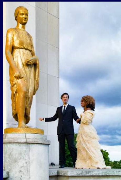
Parigi, Francia 2017