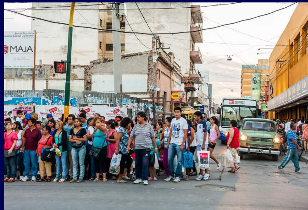
Salta, Argentina 2013