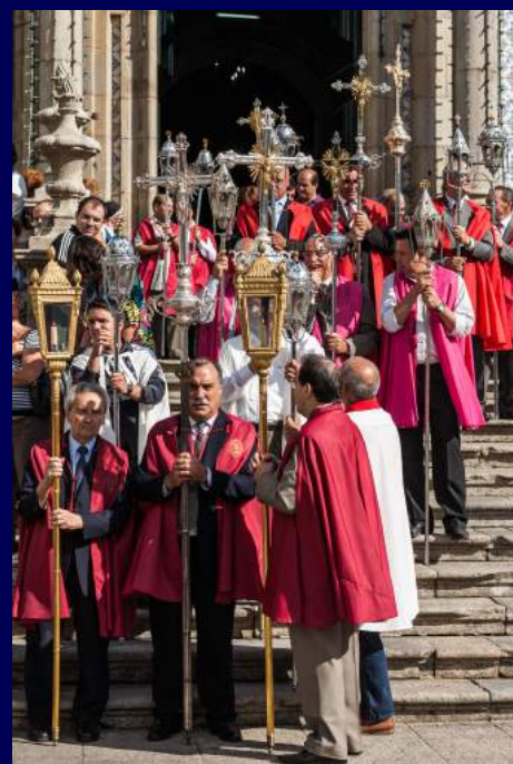
Guimarães, Portogallo 2012