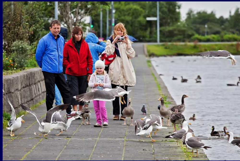
Reykjavik, Islanda 2010