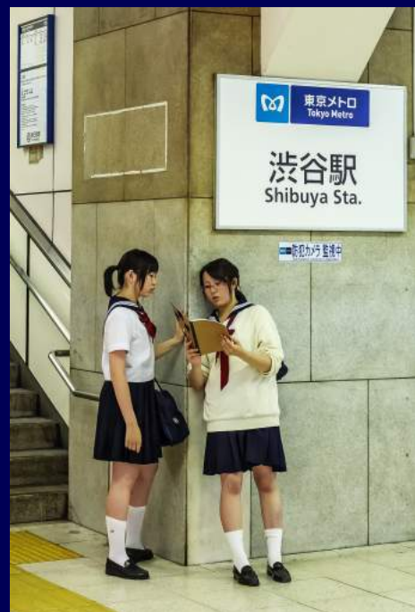
Tokyo, Giappone 2008