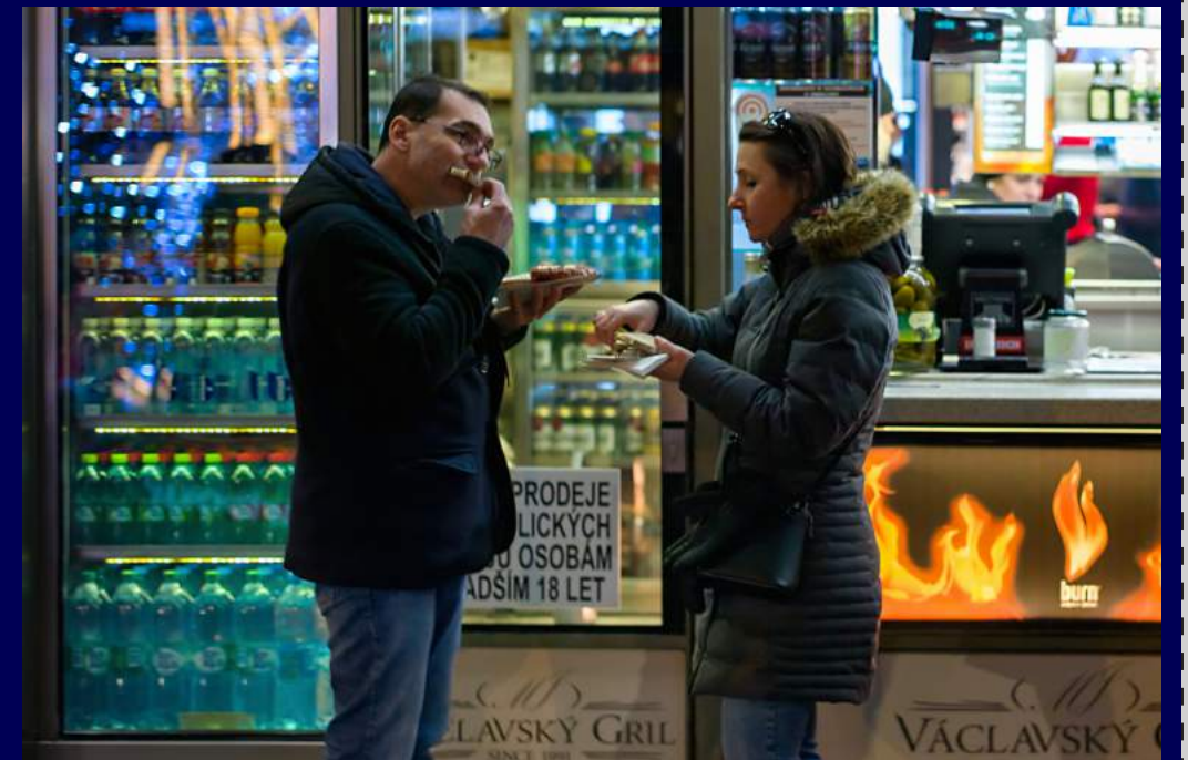
Praga, Rep. Ceca 2018