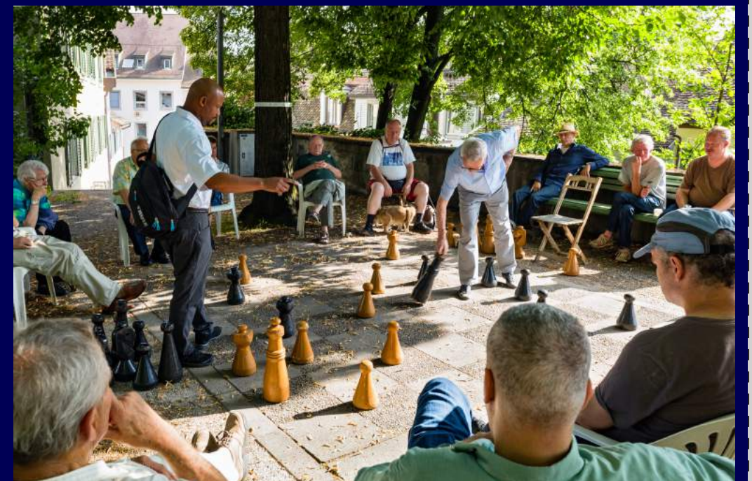
Zurigo, Svizzera 2016