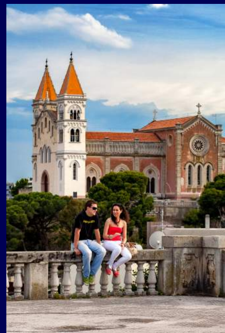
Messina, Italia 2010