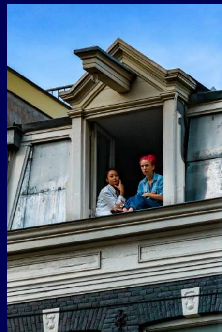
Amsterdam, Paesi Bassi 2015