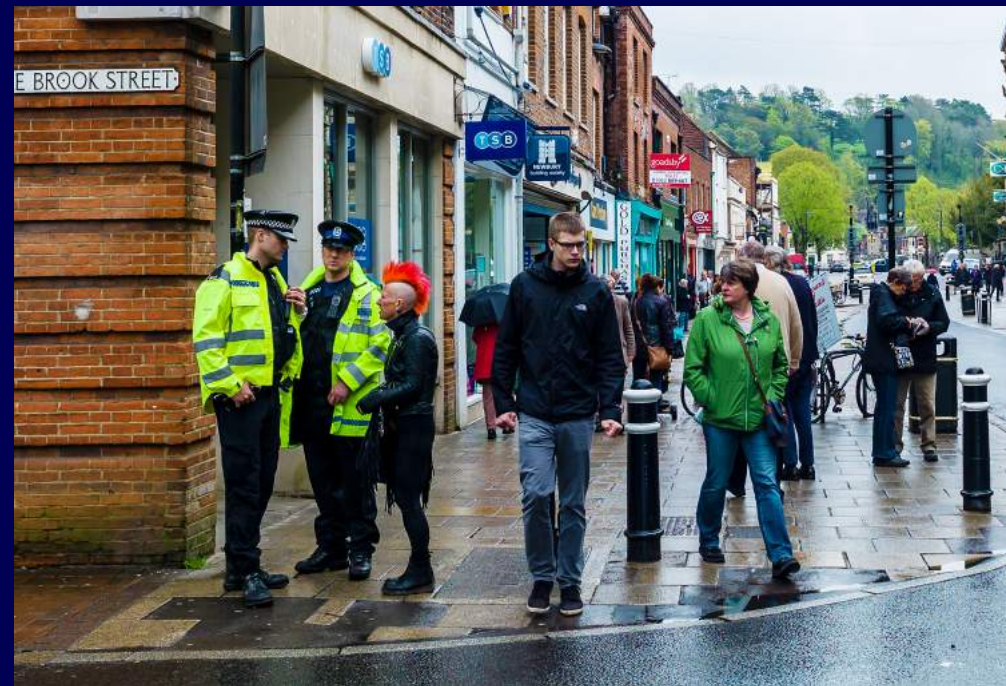
Winchester, GB 2014