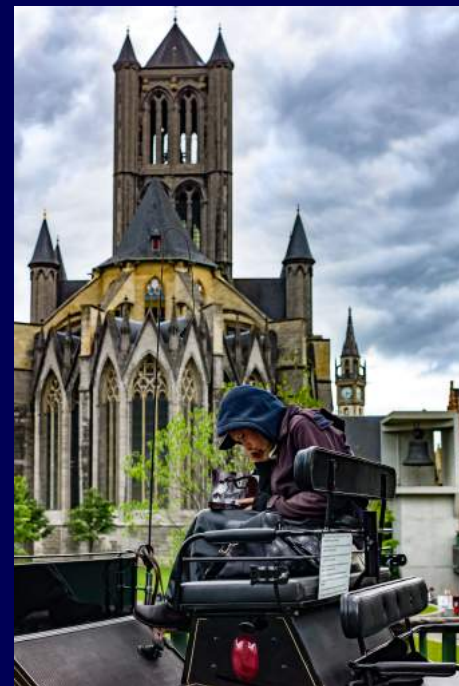
Bruges, Belgio 2015